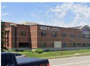
Zaczynają od 400 County Farm Road

Lokalizacja w DuPage Care Center's Outpatient Pharmacy: 400 N County Farm Road, Wheaton