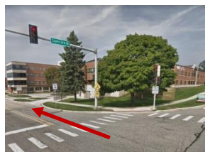
Z County Farm Road skrócić na Main Entrance Road