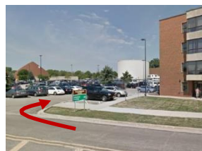
Skręć na parking dla wolontariuszy Convalescent Center