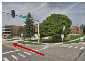
Z County Farm Road skrócić na Main Entrance Road