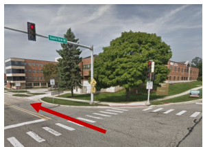
De County Farm Road doble a la calle Main Entrance Road