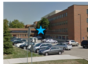
Estacionamiento disponible en el lote e ingrese a la Farmacia a través de las puertas con telas azules