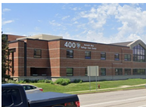
Comience en 400 County Farm

Localizado en el DuPage Care Center's Outpatient Pharmacy: 400 N County Farm Road, Wheaton