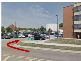
Gire hacia el estacionamiento Convalescent Center Volunteer Parking